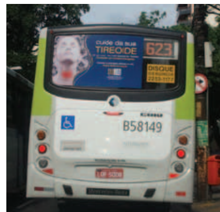
Ônibus circulando no Rio de Janeiro com o busdoor sobre os cuidados com a tireoide

A TV Globo apoiou mais uma vez a campanha da SBEM de prevenção das doenças da tireoide, exibindo gratuitamente o vídeo de 15 segundos em rede nacional, de 1 a 25 de maio, sobre o Dia Internacional da Tireoide. Além disso, também incluiu o vídeo sobre prevenção dos problemas relacionados à tireoide. ■