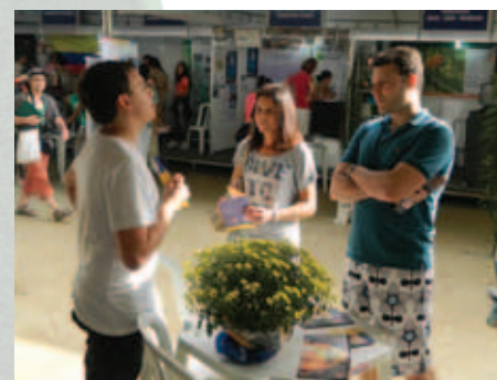
Estande da SBEM Rio, no Aterro do Flamengo, na Cúpula dos Povos

No total, a SBEM-RJ distribuiu cerca de 12 mil folders. Através deles a população teve acesso a informações sobre os principais desreguladores endócrinos, riscos relacionados à exposição a esses compostos químicos e naturais, vias de contaminação, glândulas que podem ser influenciadas e orientações de proteção à saúde. ■